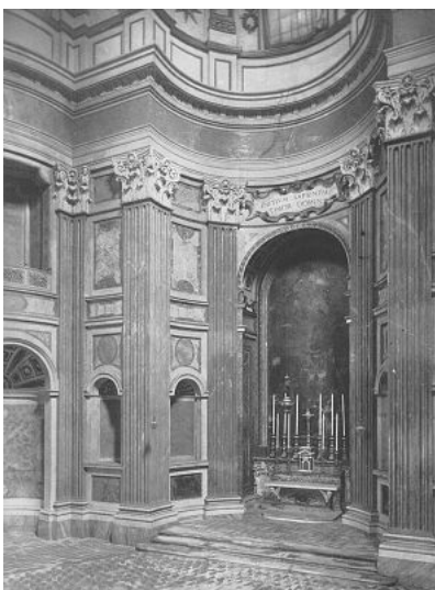
Интерьер церкви Сент Иво в Риме (арх. Ф. Борромини)

Своеобразные черты барочная архитектура приобрела в Испании усилиями Хосе Бенито Чурругеры и его братьев. Созданный ими стиливой вариант «чурругереско» характеризовался особо пышным декором фасада. Он оказал влияние на латиноамериканскую архитектуру (мексиканское «ультрабарокко»).