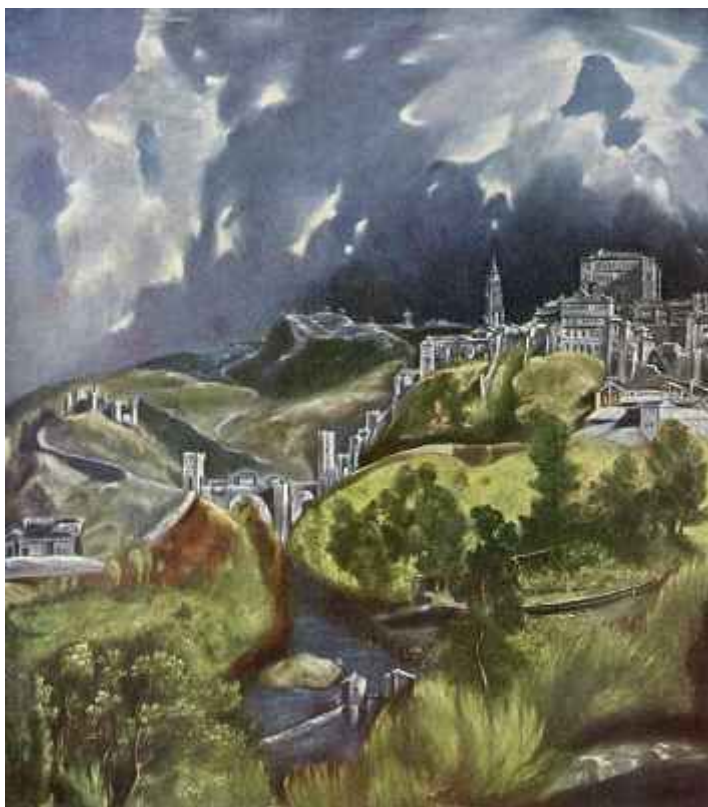
Эль-Греко. Вид на Толедо

Живопись барокко разделилась на церковную и придворно-бюргерскую. Первая широко представлена храмовыми росписями. Самым выдающимся ее представителем был Эль-Греко (Испания). Его персонажи с удлинненными фигурами и аскетическими лицами символизируют страстную веру.