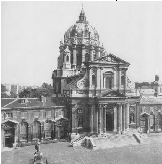
Церковь Ля Грас в Париже

Все эти детали имеют символическое значение. Криволинейные очертания, волути и волнообразность символизируют преобразование материи. Тяжелое каменное сооружение как бы на глазах меняет свой облик. Сложная символика выражена и в отдельных архитектурных памятниках. Пространство перед церковью св. Петра в Риме имеет очертания ключа, напоминая о том, что церковь есть ключ к Царствию Небесному.