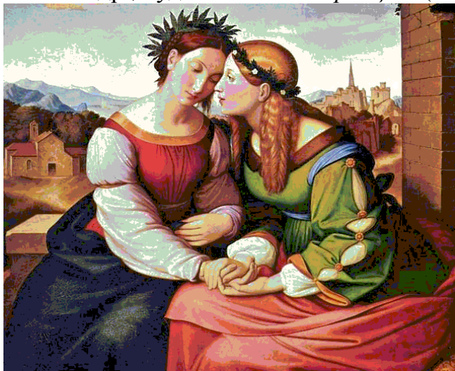
Ф. Овербек. Италия и Германия (Суламифь и Мария).

В Германии наиболее значимыми теоретиками и практиками романтизма были философы и писатели братья А. и Ф. Шлегели, Новалис, Ф.В. Шеллинг, Г. Гейне и др.; художники-«назарейцы» (Ф. Овербек и др.);