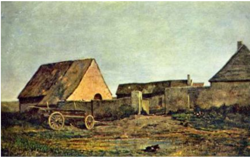
Ш.-Ф. Добиньи. Крестьянский двор.

Свои зрелые формы реалистическая живопись обрела в работах Г. Курбе и О. Домье.