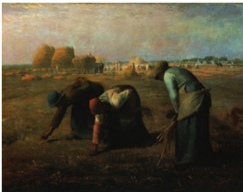
Ж.-Ф. Милле. Сборщицы колосьев

Реалистическая живопись начинается с деятельности Барбизонской школы во Франции. Ее представители (Т. Руссо, Ш.Ф. Добиньи, Ж.Ф. Милле и др.) в 30-е годы поселились в деревне Барбизон, чтобы на основе тщательных наблюдений точно запечатлеть пейзажи, нравы и характеры простых крестьян.