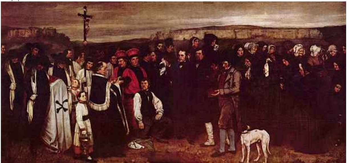
Г. Курбе. Похороны в Орнэ.

Свои зрелые формы реалистическая живопись обрела в работах Г. Курбе и О. Домье.