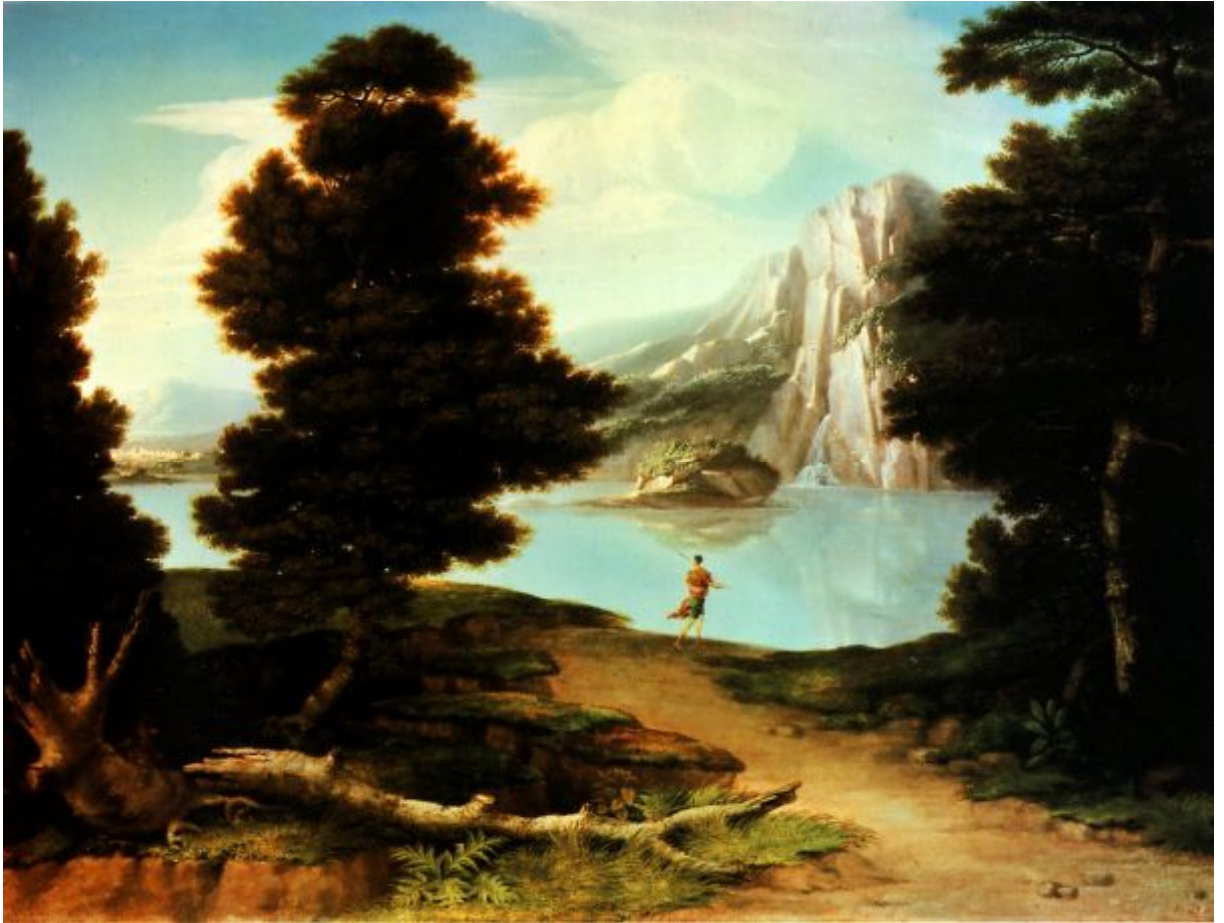
В. Олстон. Пейзаж с озером

Собственного архитектурного стиля романтизм не создал, но в центре его интересов оказалась неоготика (Виолле ле Дюк во Франции и др.).