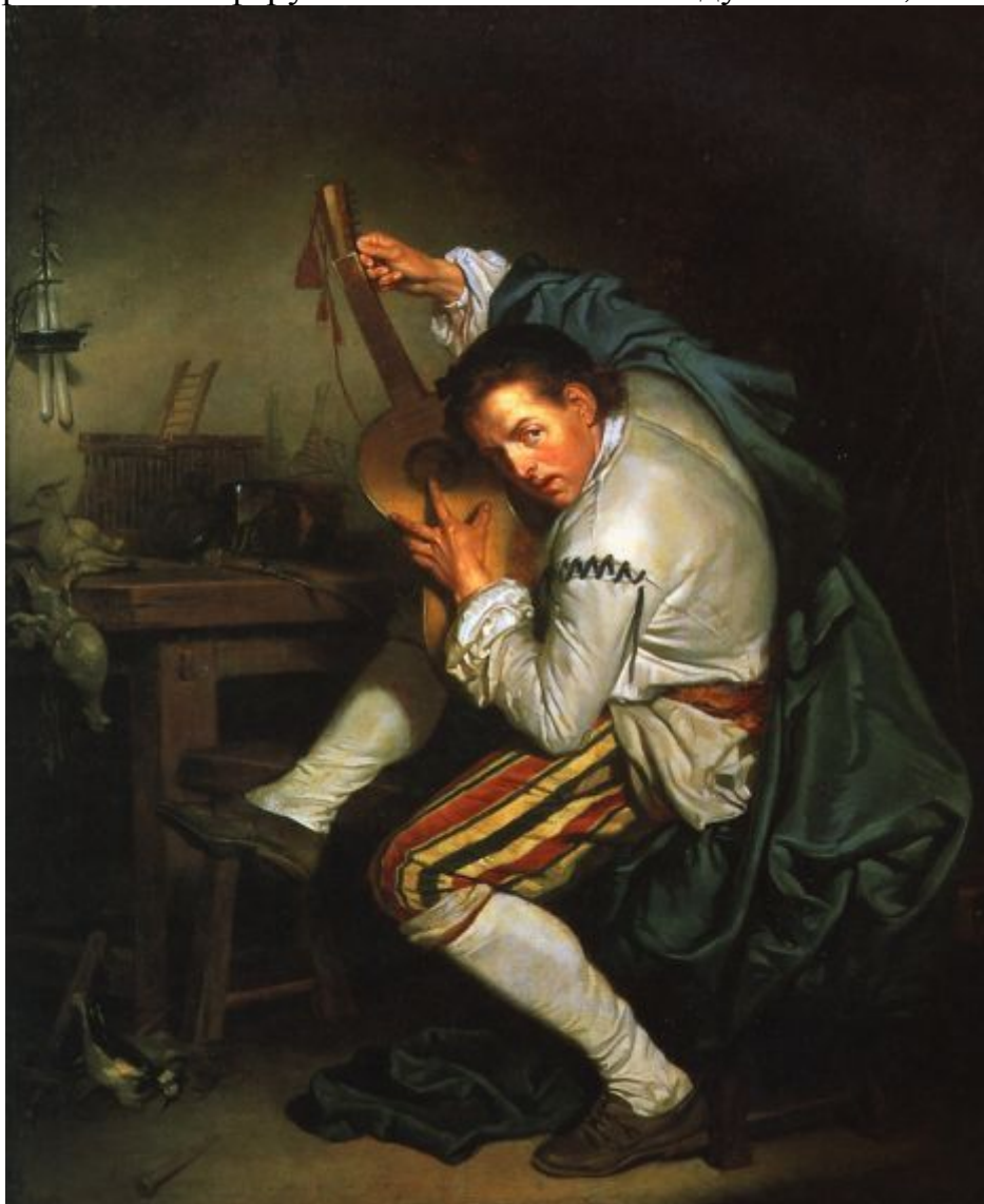
Ж.-Б. Грёз «Гитарист»

В литературе это направление представлено О. Голдсмитом («Вексфильдский священник»), ранним И.В. Гете («Страдания юного Вертера»), Ж.Ж. Руссо («Эмиль, или о воспитании», «Юлия, или новая Элоиза») и др. В живописи его развивали Б.С. Шарден, передающий в своих картинах атмосферу семейной теплоты и задушевности, Ж.Б. Грёз и т.д.