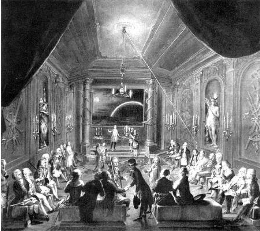
«Собрание масонской ложи в Вене с посвящением новичка в градус ученика». – Картина неизвестного художника XVIII в.

Ведущим видом искусства в этом эзотерическом течении стала, как уже отмечено, архитектура. Масонский храм символизировал Вселенную, обустроенную Великим Архитектором. Своими общими чертами он соответствовал Соломонову Храму. В плане он представлял собой прямоугольник. Потолок украшен звездами, пол сделан в виде шахматной доски, где светлые клетки обозначают добро, черные – зло. Одна стена храма не достигает потолка, что указывает на необходимость достраивания мира. Лицом к западу обращен главный вход храма с двумя эмблематическими колоннами. Левая из них – Воаз – дорического ордера и увенчана глобусом как знаком всемирности . Правая – Йахин – ионического ордера венчается тремя гранатами, обозначающими плодородие . В восточной, самой священной части храма расположен трон Мастера и алтарь со словами «Свобода. Равенство. Братство». Статуи Минервы, Геркулеса и Венеры выражают собой, соответственно, Разум, Силу и Любовь.