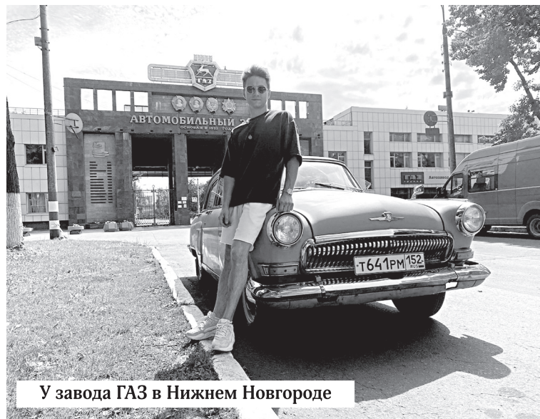
У завода ГАЗ в Нижнем Новгороде