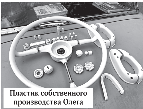
Пластик собственного производства Олега

ские шлягеры, хиты Элвиса Пресли, Джерри Ли Льюиса или «The Beatles», то создается ощущение, что ты сделал скачок во времени лет так на шестьдесят назад. Удивительные эмоции! Но на самом деле я слушаю разную музыку – и ретро, и современную. Всё зависит от настроения. Правильно выбранная песня – залог счастливого пути».