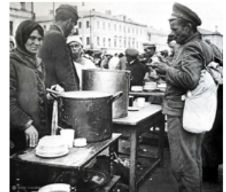
Выдача еды вместо денег

Её повсеместно заменяла натуральная оплата — выдача работникам продовольственных пайков, предметов первой необходимости табака, одежды и других товаров, которые имели реальную потребительскую ценность в условиях разрухи и товарного дефицита. Параллельно вводились бесплатные услуги: проезд на общественном транспорте, пользование жильём и коммунальными услугами. Эта система отражала вынужденный переход к натуральному хозяйству и административно-принудительным методам распределения в условиях полного коллапса рыночных механизмов.