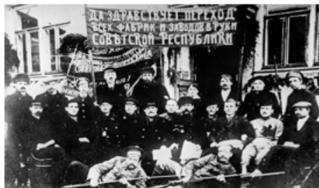
Рабочие «Ликинской мануфактуры» — первого национализированного большевиками предприятия, 1917 год

Деньги в условиях войны и печатания ничем не обеспеченных купюр стремительно обесценились. В результате денежная зарплата потеряла смысл.