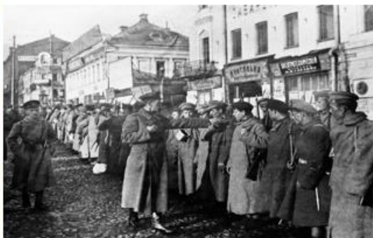
Продотряд перед отправкой в деревню

«Приехали продотрядники, забрали все до зернышка. Сказали: "Родина-мать зовет на борьбу с контрой". А у нас самих дети пухли с голоду. Мы молились, чтобы хоть картошка в погребе уцелела...» — Анонимное воспоминание крестьянина Симбирской губернии.