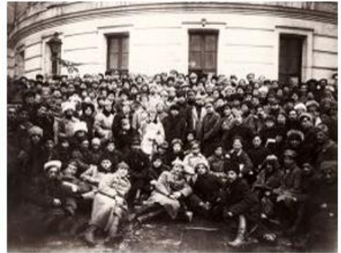
Делегаты X съезда РКП(б) 1921 г.

Х съезд Российской коммунистической партии (большевиков) проходил с 8 по 16 марта 1921 года в Москве. На съезде присутствовало 717 делегатов с решающим голосом и 418 с совещательным голосом, представлявших 732 521 члена партии. Съезд ознаменовал переход к новой экономической политике вместо военного коммунизма и принял резолюцию «О единстве партии», которая фактически запретила фракционную деятельность. Кроме того, было принято ещё 17 резолюций и постановлений, значительно изменивших состояние страны.