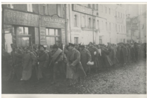
Отправка продотрядов, 1918 год, Москва

Практическое выполнение разверстки обеспечивали два основных инструмента: вооруженные продотряды, состоявшие из рабочих, и комитеты бедноты (комбеды), создававшиеся в деревнях в качестве социальной опоры власти.