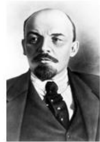
Владимир Ильич Ленин (1870 – 1924 гг.)

В 1918 г. была установлена политика военного коммунизма . Её ключевой принцип — сращивание партийного и государственного аппарата . Партия принимала решения, а государственные органы оформляли их в декреты и проводили в жизнь. Руководили проведением изменений ЦК РСДРП(б) , Совнарком и лично В. И. Ленин , при поддержке ВЧК и РККА .