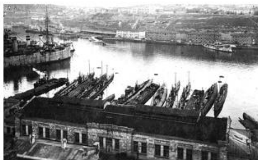
Субмарины РККФ в Севастополе

Также принципы военного коммунизма соответствовали представлениям большевиков о социалистическом обществе: отсутствие частной собственности на средства производства, ликвидация товарно-денежных отношений, уравнильное распределение материальных благ.