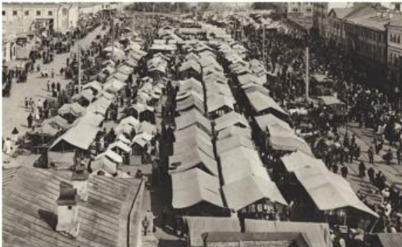
Рынок в Москве времен НЭПа 1922 г.

Главное содержание НЭПа — замена продразвертки продналогом в деревне (при продразвёрстке изымали до 70 % зерна, при продналоге — около 30 %), использование рынка и различных форм собственности, привлечение иностранного капитала в форме концессий, проведение денежной реформы (1922 -1924 гг.), в результате которой рубль стал свободно конвертируемой валютой.