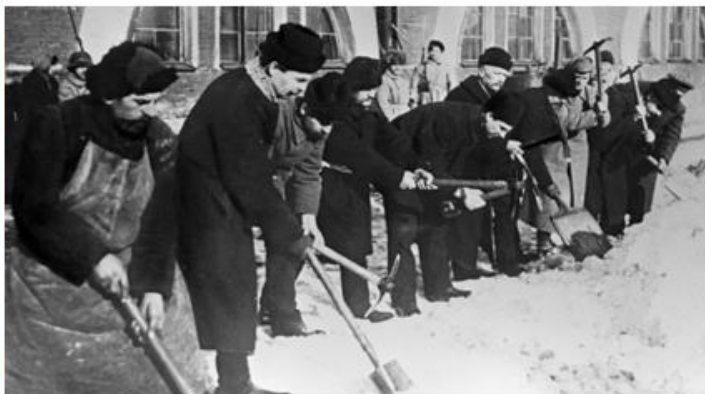
Представители буржуазии отбывают трудовую повинность

Согласно декрету СНК от 29 января 1920 года «О порядке всеобщей трудовой повинности», всё трудоспособное население, независимо от постоянной работы, привлекалось к выполнению различных трудовых заданий.