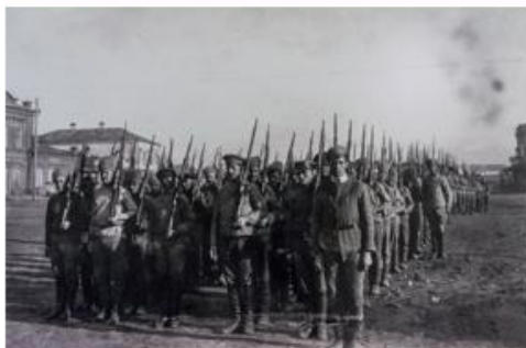
Солдаты РККА 1917 г.

Военный коммунизм был вызван дезорганизацией народного хозяйства, возникшей в результате продолжительного участия России в Первой мировой войне, революционных событий 1917 г. и последовавшей за ними Гражданской войны.