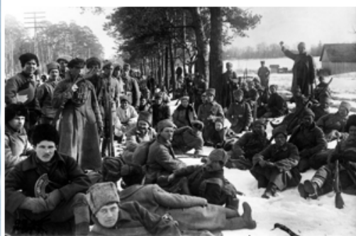
Кронштадтские моряки 1921 г.

28 февраля 1921 г. 14 000 кронштадтских моряков и рабочих выступили против власти коммунистов. Восставшие потребовали упразднить всякие политотделы и ликвидировать продразвертки.