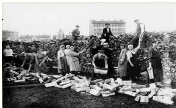
Отбывание всеобщей трудовой повинности

«Мы ходили на работу пешком за 10 верст. Обед — миска жидкой баланды из лебеды и кусок суррогатного хлеба с опилками. Одежда превратилась в лохмотья. Исчезли чувства стыда и безгласности — думали только о еде». — Воспоминания работницы фабрики в Петрограде.