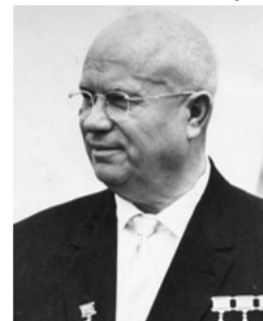
Никита Сергеевич Хрущёв (1894 – 1971 гг.) первый секретарь ЦК КПСС (1953 – 1964 гг.), председатель Совета Министров СССР (1958 – 1964 гг.)