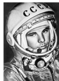
Юрий Алексеевич Гагарин (1934 – 1968 гг.) советский лётчик-космонавт, первый человек, совершивший полёт в космос

- Р.А. Медведев, "К суду истории" (1974 г.)