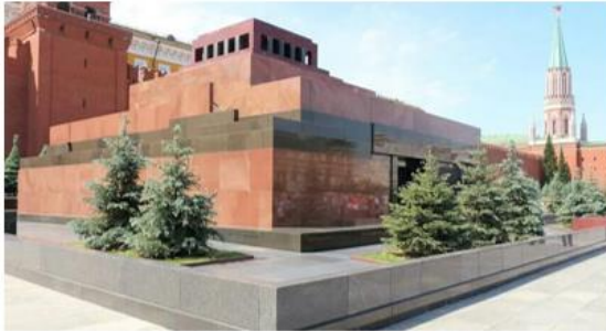
Мавзолей Владимира Ильича Ленина, г. Москва