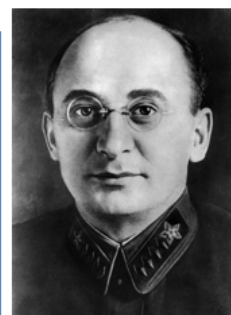
Лаврентий Павлович Берия (1899 – 1953 гг.) заместитель Председателя Совета народных комиссаров

Политбюро ЦК ВКП(б) (1919 – 1952 гг.) – высший руководящий орган партии между съездами и пленумами ЦК, принимавший все ключевые политические решения. Состояло из 10-15 человек (в разное время в него входили В.М. Молотов, Л.М. Каганович, К.Е. Ворошилов и др.).