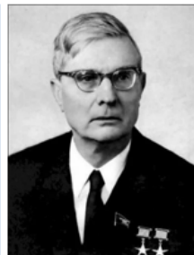
Михаил Андреевич Суслов (1902 – 1982 гг.) второй секретарь КПСС (1965 – 1982 гг.)