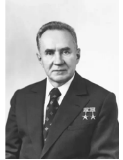
Алексей Николаевич Косыгин (1904 – 1980 гг.) председатель Совета министров СССР (1964 – 1980 гг.)