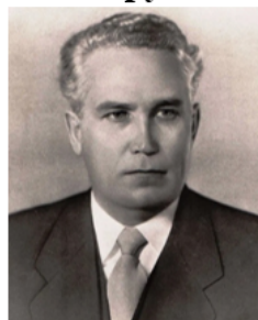
Фрол Романович Козлов (1908 – 1963 гг.) советский партийный и государственный деятель, секретарь ЦК КПСС (1960 – 1964 гг.)

Была принята на X съезде РКП(б) в 1921 году. Её главной целью был запрет фракционности и внутренней борьбы внутри правящей партии для её сплочения.