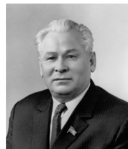
Константин Устинович Черненко (1911 – 1985 гг.) генеральный секретарь ЦК КПСС с 13 февраля 1984 года по 10 марта 1985 года