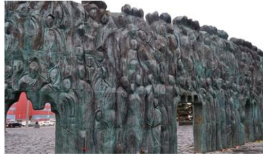
Мемориал «Стена скорби», г. Москва