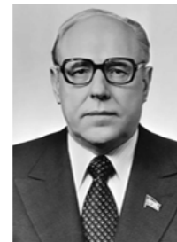
Виктор Михайлович Чебриков (1923 – 1999 гг.) депутат Верховного Совета СССР (1974 – 1989 гг.)

1984 – 1985 гг. – усугубление проблем управления.