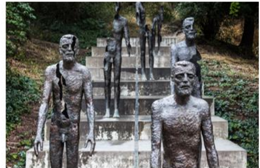
Мемориал жертвам коммунизма, г. Прага