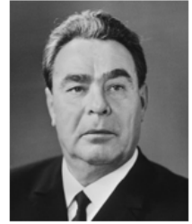
Леонид Ильич Брежнев (1906 – 1982 гг.) Генеральный секретарь ЦК КПСС с 1966 по 1982 год. Маршал Советского Союза (1976 г.).