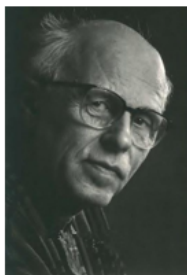
Андрей Дмитриевич Сахаров (1921 – 1989 гг.) советский физик-теоретик, академик АН СССР

"Перестройка показала: в партии были честные люди, готовые к диалогу и реформам"