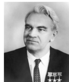
Мстислав Всеволодович Келдыш (1911 – 1978 гг.) Президент Академии наук СССР (1961 – 1975 гг.)