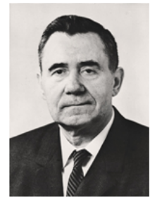
Андрей Андреевич Громыко (1909 – 1989 гг.) председатель Президиума Верховного Совета СССР (1985 – 1988 гг.)