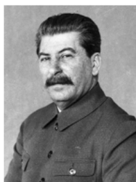
Иосиф Виссарионович Сталин (1878 – 1953 гг.) секретарь ЦК ВКП(б) с 1934 по 1935 гг.