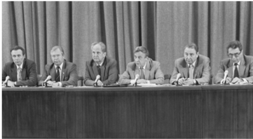
ГКЧП: А.И. Тизяков, В.А. Стародубцев, Б.К. Пуго, Г.И. Янаев, О.Д. Бакланов, Н.Н. Воронцов