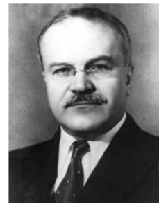
Вячеслав Михайлович Молотов (1890 – 1986 гг.) председатель Совета народных комиссаров СССР в 1930 – 1941 годах

Президиум ЦК КПСС – высший орган между съездами, заменил Политбюро с 1952 г.