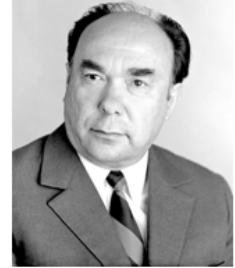
Александр Николаевич Яковлев (1923 – 2005 гг.) член Политбюро ЦК КПСС (1987 – 1990 гг.)

1987 – 1989 гг. – начало политики гласности: установление информационной открытости, появление свободы слова.