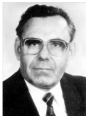
Иван Кузьмич Полозков (1935 г.р.) первый секретарь ЦК КП РСФСР

2 – 13 июля 1990 г. – XXVIII съезд КПСС с острой борьбой между реформаторами и консерваторами; избрание нового Политбюро из 24 человек (для представительства всех союзных республик).