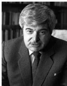
Гавриил Харитонович Попов (1936 г.р.) участник Межрегиональной депутатской группы