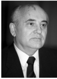
Михаил Сергеевич Горбачев (1931 – 2022 гг.) последний генеральный секретарь ЦК КПСС (1985 – 1991 гг.)