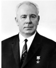
Николай Викторович Подгорный (1903 – 1983 гг.) Председатель Президиума Верховного Совета СССР (1965 – 1977 гг.)