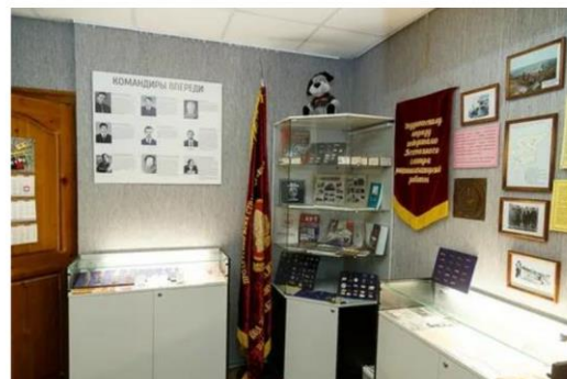
Музей всесоюзных студенческих отрядов в Сыктывкаре