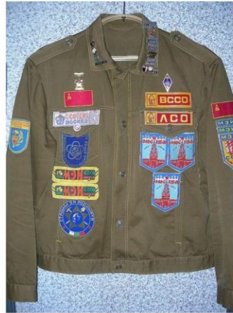
Куртка бойца студенческого строительного отряда (ССО) (1985 – 1987 г.г.)

Самобытная культура студенческих отрядов начала формироваться с первых лет существования движения и окончательно сложилась к середине 1960-х годов. Её возникновение было естественным ответом на необходимость объединения больших коллективов молодых людей в условиях напряженной трудовой деятельности и спартанского быта. Символика, ритуалы и творчество стали тем цементирующим раствором, который превращал разрозненные студенческие группы в сплоченные коллективы. Форменная куртка-«целинка», значки отрядов, вечерние «огоньки» у костра с песнями под гитару — все эти элементы создавали особое чувство принадлежности к движению, воспитывали корпоративный дух и помогали преодолевать бытовые трудности.