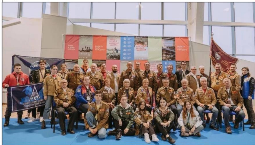
Встреча ветеранов движения в Алтайске 2020г.

Системный кризис конца 1980-х годов привел к стремительному распаду ВСО. С 1989 года началось массовое сокращение численности отрядов из-за прекращения государственного финансирования и разрыва хозяйственных договоров. Идеологический кризис подорвал воспитательную функцию движения, а роспуск ВЛКСМ в 1991 году лишил ВСО организационной основы. Запрет КПСС окончательно уничтожил идеологический стержень движения. К концу 1991 года централизованная система ВСО прекратила существование, хотя в отдельных регионах предпринимались попытки сохранить местные студенческие отряды.