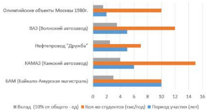
График участия студенческих отрядов во всесоюзных стройках

Студенческие отряды активно участвовали в реализации крупнейших народно-хозяйственных проектов СССР, внося значительный вклад в строительство ключевых объектов страны.