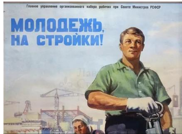
Советский агитационный плакат «Молодежь на стройки!» 1956г. Художник В. Лапшин

Послевоенное восстановление экономики и масштабная программа освоения целинных земель, начатая в 1954 году, создали острую потребность в дополнительных трудовых ресурсах. Партийное руководство рассматривало студенчество как идеальный мобильный резерв для сезонных работ. Одновременно комсомол получил задачу организовать воспитание молодежи через коллективный труд. Социальный запрос со стороны студентов включал потребность в летнем заработке, романтике путешествий и практическом применении знаний. Сложившееся сочетание экономической необходимости, политического заказа и социальных ожиданий создало предпосылки для формирования движения ВСО.