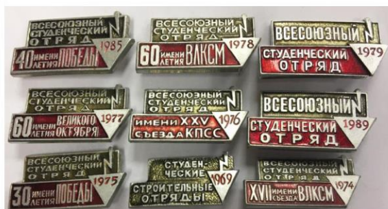
Значки всесоюзных студенческих отрядов