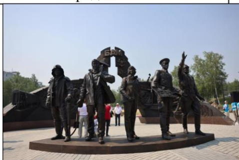
Памятник строителям БАМа в Тынде