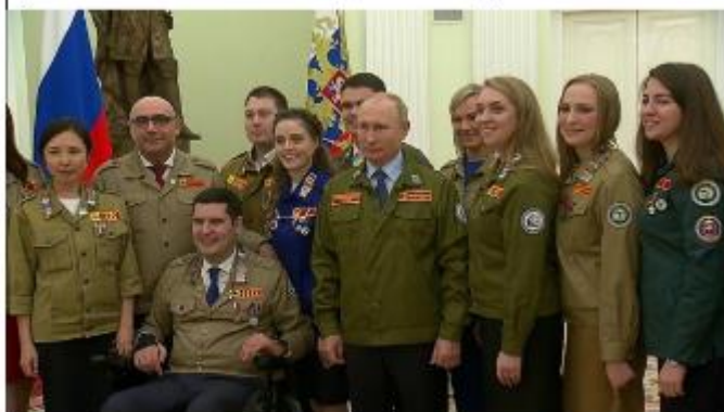
Президент России В.В. Путин в куртке бойца РСО вместе с участниками движения

В 2004 году было создано движение «Российские студенческие отряды» (РСО) как прямой преемник Всесоюзных студенческих отрядов (ВСО). Современные студотряды сохранили ключевые традиции ВСО: организационную структуру, систему трудовых семестров, атрибутику и ритуалы, включая вечерние «огоньки» и посвящение в бойцы. РСО адаптировали наследие советского движения к современным условиям, расширив направления деятельности и используя новые технологии, но сохранив главное — дух коллективизма, романтику трудовых достижений и роль «школы жизни» для молодежи.