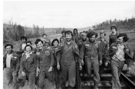
Участники студенческих отрядов на строительстве железной дороги