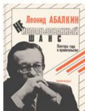
Книга Л. И. Абалкина «Неиспользованный шанс: Полтора года в правительстве»