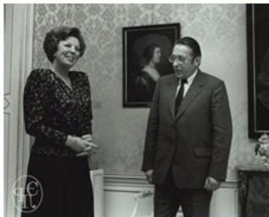
Л.И. Абалкин на встрече с королевой Нидерландов Беатрикс Вильгельмина Армгард (род. 1938 г.). 1989 г.

При участии Абалкина был подготовлен и направлен в высшие органы государственной власти совместный доклад Отделения экономики РАН и международного фонда «Реформа» «Социально-экономические преобразования в России: современная ситуация и новые подходы» (1994 г.).