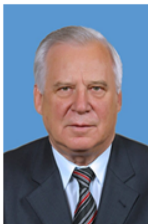
Николай Иванович Рыжков 2016 г.

В период работы заместителем председателя Совета Министров СССР (1989 – 1991 гг.) Абалкин тесно взаимодействовал с: