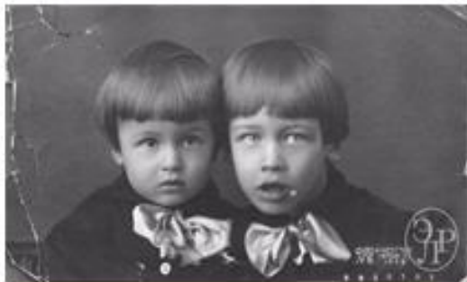
Леонид Абалкин с братом Станиславом. Москва. 1932 г.

Леонид Иванович Абалкин (5 мая 1930 г., Москва — 2 мая 2011 г., Москва) — советский и российский экономист, академик АН СССР и РАН, доктор экономических наук, профессор.