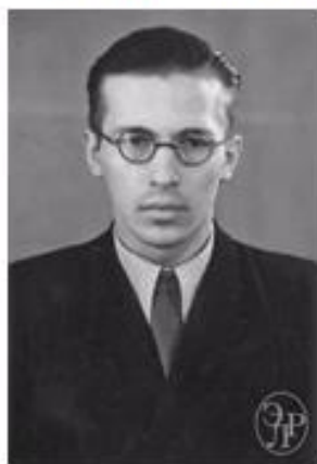
Л.И. Абалкин в период работы в Калининградском сельскохозяйственном техникуме. 1953 - 1958 гг.