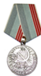
Медаль Ветеран труда