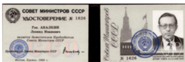
Удостоверение председателя Совета министров СССР. 1989г.