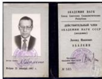
Удостоверение действительного члена АН СССР Л.И. Абалкина.