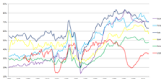
График реального ВВП на душу населения в сравнении с другими странами