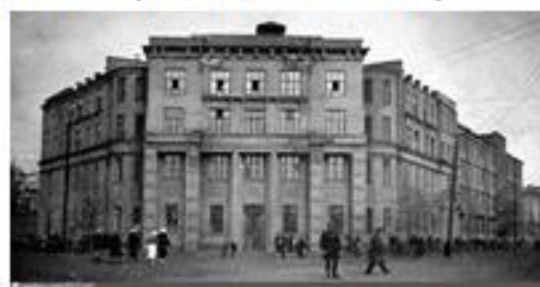
Институт народного хозяйства имени Г.В. Плеханова