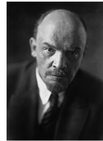
Ленин Владимир Ильич (1870 – 1924 гг.)