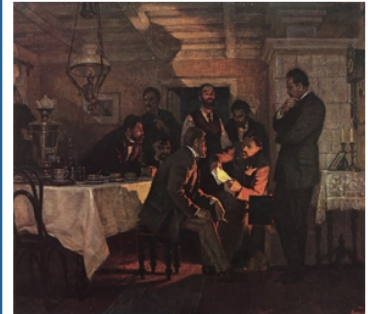
I Съезд РСДРП (1898 г.)