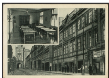
Прага. Дом по Гибернской улице № 7, где проходила Пражская конференция РСДРП.

В январе 1912 г. на Пражской конференции под руководством Ленина большевики объявили о разрыве с меньшевиками и создании самостоятельной, строго централизованной партии — РСДРП(б). Был избран новый ЦК, что завершило оформление большевиков в отдельную политическую силу.