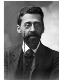
Мартов Юлий Осипович (1873 – 1923 гг.)