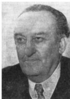
Иштван Ковач (1892 – 1971 гг.) – и.о. Министра обороны Венгрии