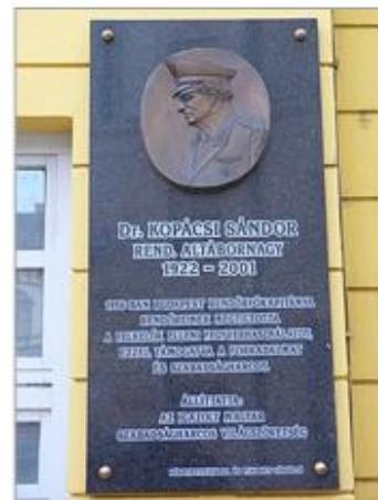
Мемориальная доска Шандору Копачи (1922 – 2001 гг.) – начальнику будапештской полиции в 1956 году.

23:00 23 октября 1956 года – на основании решения Президиума ЦК КПСС начальник Генштаба Вооружённых сил СССР маршал В.Д. Соколовский приказал командиру Особого корпуса начать выдвижение в Будапешт для оказания помощи венгерским войскам «в восстановлении порядка и создания условий для мирного созидательного труда».