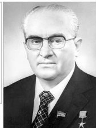
Юрий Владимирович Андропов (1914 – 1984 гг.) – Советский партийный и государственный деятель, посол СССР в Венгрии (1954 – 1957 гг.), председатель КГБ СССР (1967 – 1982 гг.), Генеральный секретарь ЦК КПСС (1982 – 1984 гг.).

Он рассматривал события в Венгрии как предупреждение для всего соцлагеря, поэтому в 1970-е годы КГБ активно отслеживали настроения в Польше, Чехословакии и ГДР.