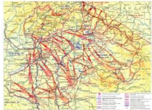
Будапештская операция 1944 г. на карте

Уже в апреле 1945 года территория Венгрии полностью освобождена. В стране остаются части Красной армии, которые оказывают влияние на послевоенные процессы.