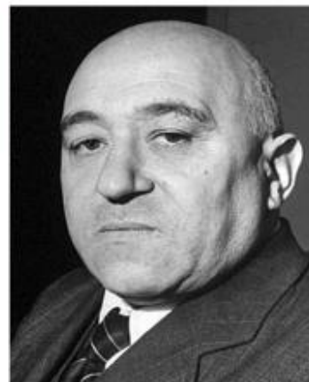
Матьяш Ракоши (1892 – 1971 гг.) – венгерский государственный, политический и партийный деятель.

Оценка представителя венгерской партии «Демократическая коалиция».