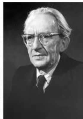
Дьёрдь Лукач (1885 – 1971 гг.) – Министр иностранных дел Венгрии