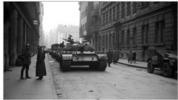
Советские танки Т-54. Будапешт, 1956 г.

Янош Кадар объявляет себя главой нового просоветского правительства. Начинаются массовые аресты, казни и репрессии.