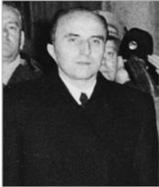
Андраш Хегедюш (1922 – 1999 гг.) — венгерский политический и партийный деятель. Председатель Совета министров Венгерской Народной республики (1955 — 1956 гг.)

28 июня 1953 года – на пленуме Центрального руководства ВПТ Матяш Ракоши был смещён с поста главы правительства, однако сохранил пост первого секретаря ВПТ.