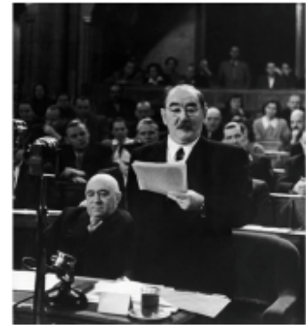
Первый секретарь ЦК ВПТ Матьяш Ракоши и председатель Совета министров ВНР Имре Надь на сессии Государственного собрания. Будапешт. 28 октября 1956 г.