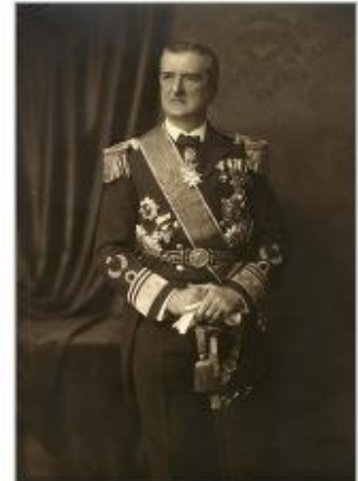
Миклош Хорти (1868 – 1957 гг.) – венгерский адмирал, регент Королевства Венгрия в межвоенный период и большую часть Второй мировой войны.

После оккупации из Венгрии было депортировано \approx 700\,000 евреев в Освенцим.