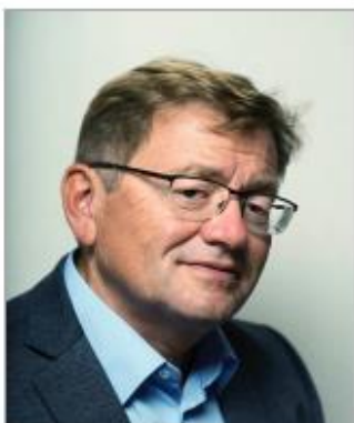
Владислав Мартынович Зубок (1958 – н.в. гг.) – профессор, специалист в вопросах истории XX века, кандидат исторических наук

«События в Венгрии носили контрреволюционный характер и угрожали стабильности социалистического лагеря. Ввод войск был вынужденной мерой для предотвращения выхода страны из сферы влияния СССР».