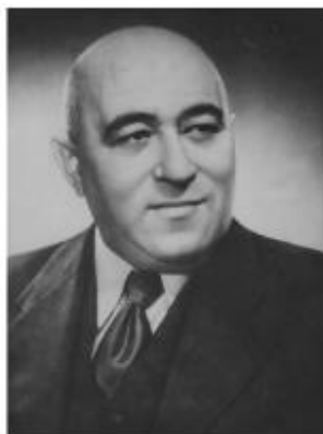
Матьяш Ракоши (1892 – 1971 гг.) – Председатель Президиума Великого национального собрания, Председатель Совета министров, Генеральный секретарь Венгерской рабочей партии

Можно сказать, что власть была централизована в руках Матьяша Ракоши, и он контролировал все аспекты политической и экономической жизни