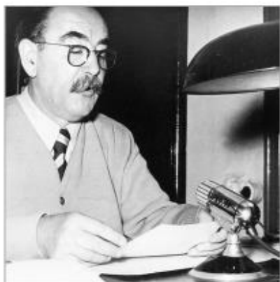
Имре Надь объявляет о выходе Венгрии из ОВД

Ночь 31 октября 1956 года – завершается подготовка « Операция "Вихрь" »