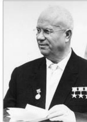
Никита Сергеевич Хрущёв (1894 – 1971 гг.) – Первый секретарь ЦК КПСС (1953—1964 гг.). Председатель Совета Министров СССР (1958—1964 гг.).

«Дать оценку происходящему, войска из Венгрии и Будапешта не выводить и проявить инициативу в наведении порядка. Если мы уйдём из Венгрии, то это подбодрит американцев, англичан и французских империалистов. Они воспримут это как нашу слабость и будут наступать»