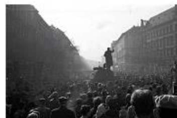
Выступление протестантов. Венгрия, 1956 г.