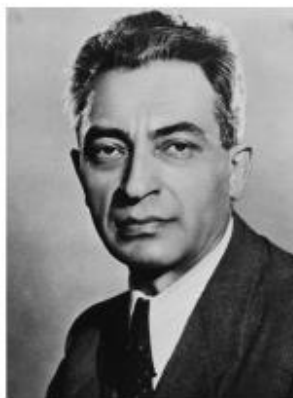
Эрнё Герё (1898 – 1980 гг.) – Министр внутренних дел Венгрии