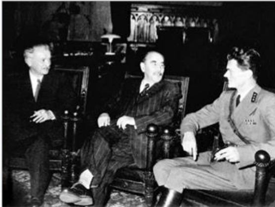
Геза Лошонци, Имре Надь, Пал Малетер Фото от 2 ноября 1956 г.

Он надеется, что международное сообщество защитит Венгрию. Часть членов правительства (включая Яноша Кадара ) начинает тайно сотрудничать с СССР, опасаясь полного краха режима и репрессий.