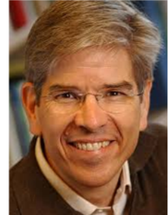
Пол Ромер (1955 г.)

Определил человеческий капитал как запас навыков и знаний индивидов, который является ключевым входным ресурсом для производства новых технологий и идей, что, в свою очередь, запускает процесс эндогенного (внутреннего) и непрерывного экономического роста.