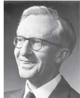
Теодор Уильям Шульц (1902 – 1998 гг.)

Научный труды: «Формирование капитала образования» (1960 г.), «Инвестиции в человеческий капитал» (1961 г.), «Экономическая ценность образования» (1963 г.), «Преобразование традиционного сельского хозяйства» (1964 г.), «Инвестиции в человеческий капитал: роль образования и исследований» (1971 г.), «Инвестиции в людей: Экономика качества населения» (1981 г.).