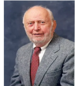
Дуглас Сесил Норт (1920 – 2015 гг.)

Дуглас Сесил Норт (1920 – 2015 гг.) – американский экономист, нобелевский лауреат 1993 года, один из основателей неоинституциональной экономики . Дуглас Норт показал, что долгосрочный экономический рост невозможен без институтов, гарантирующих возврат от вложений в человеческий капитал, что объясняет различия в развитии стран с одинаковым исходным уровнем знаний и навыков. В своей работе « Институты, институциональные изменения и функционирование экономики » 1990 года раскрыл ключевые аспекты: