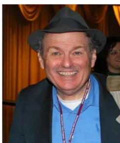
Ричард Фримен (1943 г.)

Ричард Фримен (1943 г.) – американский экономист, профессор экономики Гарвардского университета.