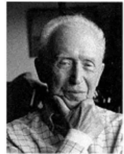
Джейкоб Минсер (1922 – 2006 гг.)

В 1958 году в статье «Инвестиции в человеческий капитал и распределение личных доходов» впервые ввел термин «человеческий капитал» – совокупность знаний, навыков и компетенций, приобретаемых через формальное образование и профессиональную подготовку, которые увеличивают производительность индивида и приносят экономическую отдачу в виде более высоких пожизненных доходов.