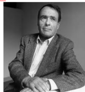
Пьер Бурдьё (1930 – 2002 гг.)

1980 год – в работе «Практический смысл» четко формулирует теорию различных видов капитала.