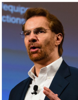
Эрик Брюньольфсон (1962 г.)

С формированием платформенной экономики возникает понятие « цифрового человеческого капитала » – совокупность знаний, навыков, умений и компетенций человека, связанных с использованием цифровых технологий, которые он применяет для достижения личных, профессиональных и социальных целей.