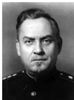
Николай Александрович Булганин (1895 — 1975 гг.) член Политбюро ЦК ВКП(б) советский государственный и партийный деятель, маршал Советского Союза

«Центральный Комитет уделил особое внимание укреплению партийных организаций на местах. Была проведена массовая проверка первичной сети, выявлены слабые звенья, устранены расхождения между директивами центра и действиями региональных партийных бюро. Мы организовали специальные курсы подготовки партийных работников, обучение методам эффективной работы с населением, распространение положительного опыта лучших коллективов. Благодаря этому существенно повысилась дисциплина и эффективность местной партийной работы».