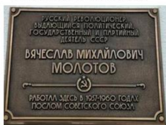
Мемориальная доска в честь Вячеслава Михайловича Молотова в Улан-Баторе, Монголия, 2024 г.