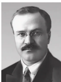
Вячеслав Михайлович Молотов (1890 — 1986 гг.)