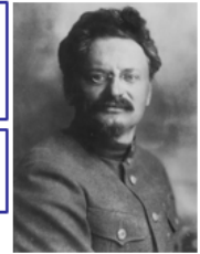
Лев Давидович Троцкий (1879 — 1940 гг.)

1929 г. — совещание И.В. Сталина с марксистами — начало формирования догматического толкования марксизма, окончательно закреплённого в 1938 г. в учебнике «История ВКП(б): Краткий курс».