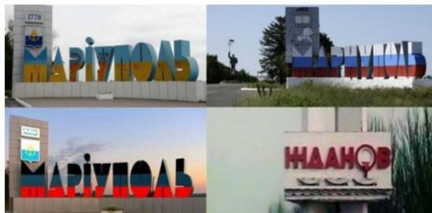
Переименование города Жданов в Мариуполь, 1991 г.