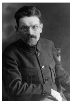
Михаил Иванович Калинин (1875 — 1946 гг.) член Политбюро ЦК ВКП(б), советский государственный и партийный деятель