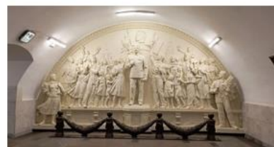
«Благодарность народа вождю-полководцу» — название барельефа с изображением Иосифа Виссарионовича Сталина, открытого в мае 2025 года в переходе между станциями метро «Таганская».