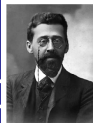
Юлий Осипович Мартов (1873 — 1923 гг.)

1925 г., XIV съезд ВКП(б) — переименование РКП(б) в ВКП(б)