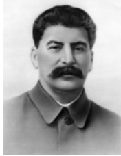
Иосиф Виссарионович Сталин (1878 — 1953 гг.)

1925 – 1927 гг. — борьба с «объединённой оппозицией» (Г.Е. Зиновьев, Л.Б. Каменев, Л.Д. Троцкий); исключение их из партии.