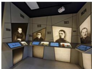
Дом-музей Андрея Александровича Жданова в Мариуполе (бывший город Жданов). Открыт 15 февраля 2025 года.