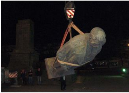
Демонтаж памятника И.В. Сталину в Гори Грузия, 2010 г.