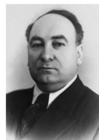
Пантелеймон Кондратьевич Пономаренко (1902 — 1984 гг.)

30 мая 1942 г. — постановлением ГКО создан Центральный штаб партизанского движения (ЦШПД) , под руководством П.К. Пономаренко , первого секретаря ЦК КП(б) Белоруссии. Штаб координировал: действия партизан, снабжение, разведку и диверсии. Формально подчинялся Ставке ВГК , но политическое руководство осуществлялось через Военный отдел ЦК ВКП(б) , возглавлявшийся также П.К. Пономаренко .