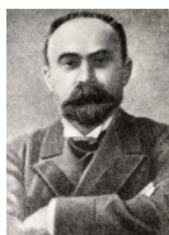
Георгий Валентинович Плеханов (1856 — 1918 гг.)

1898 г. — I съезд РСДРП: создание партии, первые попытки объединения марксистов в России (в начале XX века насчитывалось более 150 партий).