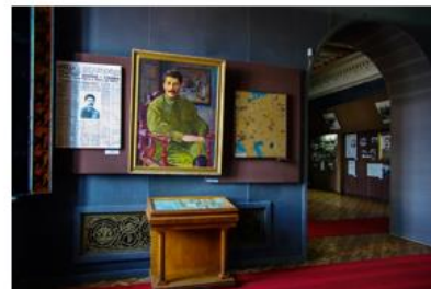
Музей Иосифа Виссарионовича Сталина в Гори, Грузия. Открыт в 1937 году.