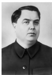
Георгий Максимилианович Маленков (1902 — 1988 гг.)