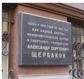
Мемориальная доска Александру Сергеевичу Щербакову на доме в Москве (Романов переулок, 3, стр. 7). Установлена в 1973 году.