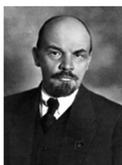
Владимир Ильич Ленин (1870 — 1924 гг.)