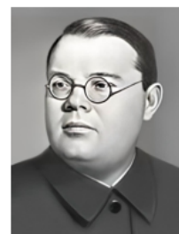
Александр Сергеевич Щербаков (1901 — 1945 гг.)

24 июня 1941 г. — постановлением СНК и ЦК ВКП(б) создано Советское информационное бюро (Совинформбюро) . Руководитель — А.С. Щербаков , кандидат в члены Политбюро, секретарь ЦК ВКП(б). Орган распространял сводки с фронта и материалы для прессы, находился под контролем Управления пропаганды и агитации . Одновременно А.С. Щербаков курировал Военный отдел ЦК ВКП(б) , отвечавший за связь с фронтом.