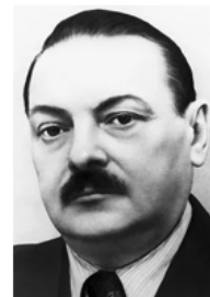
Андрей Александрович Жданов (1896 — 1948 гг.)