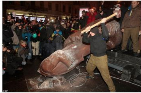
Снос памятника В.И. Ленину в Киеве, 2013 г.