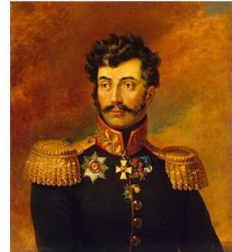
Р. И. Багратион (1778 – 1834 гг.)

25 июня 1829 г. – произведен в генерал-лейтенанты за отличия в войне с турками.