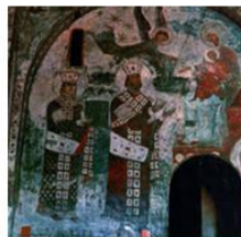
Фреска, изображающая царицу Тамару и ее отца царя Георгия III, высеченная в скале пещерного монастыря Вадзиа в XII-XIII веках.