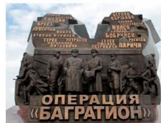
Монумент операции «Багратион», Гомельская область, фото 2018 г.