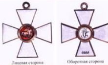
Орден Святого Георгия

Лейб-гвардии Гусарский Его Величества полк — лейб-гвардейский гусарский полк Русской императорской армии.