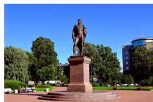
Памятник П. И. Багратиону, г. Санкт-Петербург 2012 г.

Во многих городах России и других стран, включая Москву, Калининградскую область, Иркутск, Смоленск, Симферополь, Минск и Тбилиси существуют улицы, проспекты, переулки и даже станция метро и мост в честь полководца П. И. Багратиона.