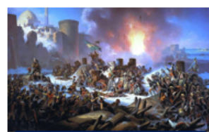
«Штурм Очакова». Художник Я. Суходольский, 1853 г.

Эполеты — разновидность погон, наплечные знаки различия военных чинов и воинского звания на военной форме.