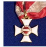
Орден Марии Терезии