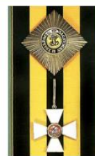
Орден Св. Георгия