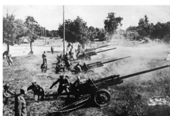
Белоруссия, 1944 г.