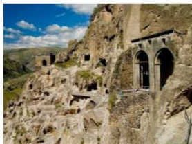
Пещерный монастырский комплекс Вадзиа, фото 2022 г.