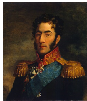
Князь П. И. Багратион. Художник Дж. Доу 1822 – 1823 гг.

Военная карьера Багратиона развивается стремительно не только из-за принадлежности к имперской аристократической элите и за счет широких родственных связей, но и благодаря исключительной храбрости.