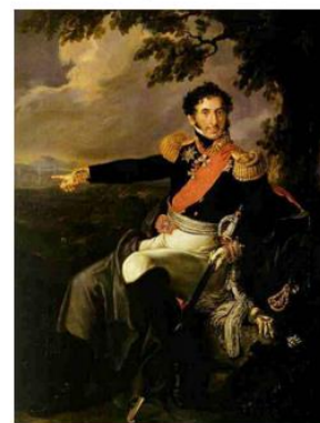
П. И. Багратион (1765 – 1812 гг.)

август 1811 г. – генерал от инфантерии Багратион назначается главнокомандующим Подольской армией (с марта 1812 г. – Вторая Западная армия)