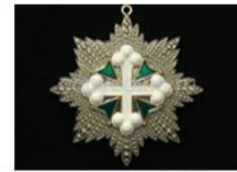
Орден Святых Маврикия и Лазаря