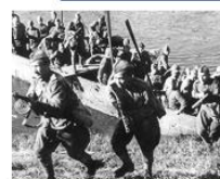
Операция «Багратион» в Витебске