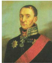
Яков Васильевич Виллие (1768 – 1854)

Яков Федорович Виллие - яркая историческая личность, почти 50 лет стоял у руля военной медицины Российской империи, почти 30 лет возглавлял Медико-хирургическую академию. Он служил личным врачом трех русских императоров. Особенно заметной стала деятельность Я. В. Виллие во время Отечественной войны 1812 г., когда на его плечи была возложена задача по медицинскому обеспечению трехсоттысячной русской армии.