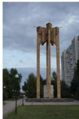
Стела, посвящённая 200-летию Георгиевского трактата между Россией и Грузией, г. Георгиевск

Георгиевский трактат представляет собой договор между Россией и грузинским царством Картли-Кахети (Восточная Грузия) о признании грузинским царем Ираклием II покровительства России. Протекторат — это форма зависимости одного, более слабого государства от более сильного, при которой государство-протектор берет на себя защиту и покровительство, но при этом государство-протекторат, сохраняя внутреннюю самостоятельность и собственную власть, фактически подчиняется сильному государству, особенно в вопросах внешней политики и обороны.