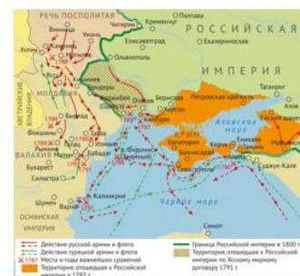
Русско-турецкая война 1787–1791 годов

1801 г. – Восточная Грузия вошла в состав России.