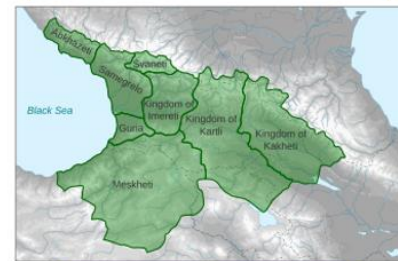
Картлийское царство 1490 — 1762 гг.

Надир-шах Афшар — шах Персии в 1736—1747 годах, основатель династии Афшаридов, полководец. Картлийское царство (Карталинское царство, Картли) — феодальное государство в Восточной Грузии со столицей в Тифлисе, возникшее в конце XV века.