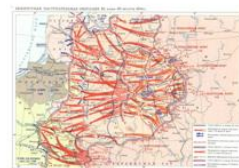
Белорусская наступательная операция 23 июня – 29 августа 1944 г.

Название операции символически связало два героических сражения за белорусскую землю в разные исторические периоды, отдавая дань памяти полководцу, командовавшему войсками на этой территории более ста лет назад.