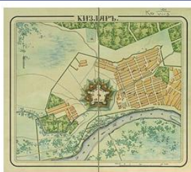
План Кизлярской крепости. 1830-е годы

Сейчас надпись на одной из сторон пирамиды видна следующая: «Под сим камнем положено тело грузинского царевича Александра сына князя Ивана Александровича Багратиона родившегося 1730 года ноября в 1-й день прожившего 65 лет скончавшегося в 1795 году Сей памятник воздвигнул любезнейший сын его князь Петр Иванович Багратион»