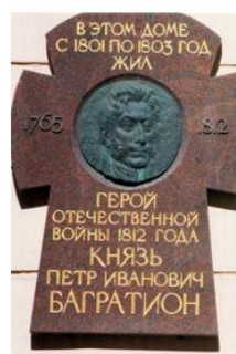
Мемориальная доска на доме, в котором жил П. И. Багратион, г. Санкт-Петербург