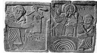
Рельеф изображающий царя-пророка Давида

Род Багратуни – древний армянский княжеский род, известный как Багратиды или Багратиони. Тайк – это армянское название исторической области Тао, которая сейчас находится на территории Турции. Эристава – грузинский титул, в античной и раннесредневековой Грузии обозначавший государственную должность, а в более позднее время – наследственный статус феодала.