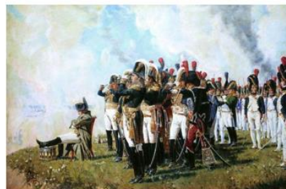
«Наполеон на Бородинских высотах». Художник В. Верещагин, 1897 г.

Окончание битвы — около 18:00 французская армия была истощена. Наполеон не решился ввести в бой свою гвардию и отдал приказ прекратить наступление. Битва завершилась без решающего перевеса в пользу одной из сторон.