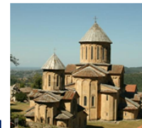
Гелатский монастырь, Грузия 2013 г.

Дидгорская битва — сражение, которое произошло 12 августа 1121 года между войсками Грузинского царства и сельджукскими войсками.