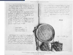
Георгиевский трактат, место подписания г. Георгиевск 24 июля (4 августа) 1783 г.

Документ состоял из 13 основных и 4 сепаратных статей. Грузинский царь Ираклий II признавал покровительство России и отказывался от самостоятельной внешней политики, обязываясь своими войсками служить российской императрице. Екатерина II со своей стороны ручалась за сохранение целостности владений Ираклия II. Грузии предоставлялась полная внутренняя автономия. Статьи 8-я, 9-я, 10-я и 11-я уравнивали в правах грузинские привилегированные сословия (дворян, духовенство и купечество) с русскими. Важное значение имели 4 сепаратные статьи договора. По ним Россия обязалась защищать Грузию в случае войны, а при ведении мирных переговоров настаивать на возвращении Картлийско-Кахетинскому царству владений, издавна ему принадлежавших.