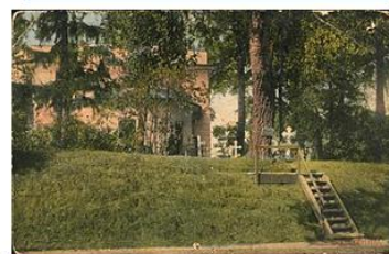
Семеновская флеш в 1912 году. Место гибели генерал-майора А. А. Тучкова

Шевардино — деревня в Можайском районе Московской области в составе сельского поселения Бородинское. Флеши — полевые, зачастую долговременные, укрепления.