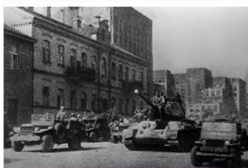
Вступление Красной Армии в Минск (Минская наступательная операция 29 июня – 4 июля 1944 года).