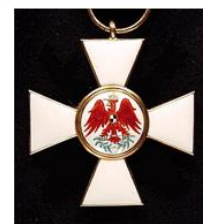
Орден Красного орла

Большинство своих воинских званий князь Багратион добыл в сражениях, а не по выслуге лет или благоволению начальства. Подпоручиком он стал при Очакове, подполковником – по результатам Польской кампании, генерал-лейтенантом – за Шёнграбен, генералом от инфантерии – за взятие Аландских островов. Если бы не смертельная рана под Бородином, фельдмаршальский жезл вряд ли бы обошёл полководца.