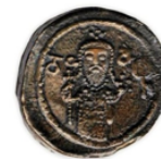
Монета с изображением царя Давида, создана в 1150 г.