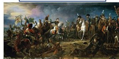
«Наполеон при Аустерлице». Художник Ф. Жерар, 1810 г.

С августа 1811 года, будучи главнокомандующим 2-й Западной армией, Багратион предвидел нападение Наполеона и разработал план обороны, чтобы отразить агрессию. Его деятельность в этот период была направлена на повышение боеготовности армии и укрепление оборонительных позиций в ожидании войны.