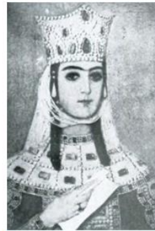
Царица Тамара Великая (1166 – 1213 гг.)