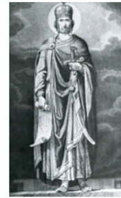
Икона XI-XII века «Царь Давид Строитель». Из коллекции литературного музея Грузии

Его образ увековечен в памятниках, церквях и других архитектурных сооружениях по всей Грузии. Его имя носят улицы, города и даже национальная валюта (лари) имеет изображение Давида IV на своих монетах.