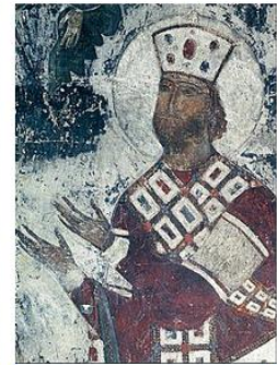
Царь Георгий III (ум. 27 марта 1184 г.)