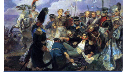
«Смертельное ранение генерала П.И. Багратиона в Бородинском сражении». Художник А.И. Вепхвадзе, 1948 г.

О характере ранения М. И. Кутузов мог знать только из докладов подчиненных, и в частности Я. В. Виллие. И раз М. И. Кутузов в своем донесении сообщил о пулевом ранении П. И. Багратиона, значит, так ему и было доложено.