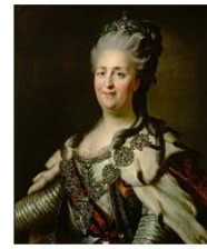
Екатерины II, 1780-е годы.

Основное политическое значение Георгиевского трактата заключалось в том, что он установил протекторат России в отношении Восточной Грузии, а также резко ослабил позиции Ирана и Турции в Закавказье, формально уничтожив их притязания на эту территорию.