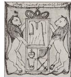
Герб династии Багратионов

Багратионы происходили из знатного княжеского рода. Предки Багратионов были крупными аристократами (эриставами) в юго-западной Грузии. В VIII-IX веках, в сложный период арабского владычества, они ловко маневрировали между Арабским халифатом и Византийской империей. В 888 году князь Адарнасе IV из этого рода принял титул «Царя картвелов (грузин)», что считается официальным началом царской династии Багратионов. Название рода происходит от очень популярного в их семье имени Баграт.