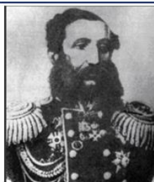
Иван Александрович Багратион (1730 – 1795 гг.)