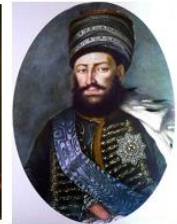
Ираклий II, XIX в.

Документ состоял из 13 основных и 4 сепаратных статей. Грузинский царь Ираклий II признавал покровительство России и отказывался от самостоятельной внешней политики, обязываясь своими войсками служить российской императрице. Екатерина II со своей стороны ручалась за сохранение целостности владений Ираклия II. Грузии предоставлялась полная внутренняя автономия. Статьи 8-я, 9-я, 10-я и 11-я уравнивали в правах грузинские привилегированные сословия (дворян, духовенство и купечество) с русскими. Важное значение имели 4 сепаратные статьи договора. По ним Россия обязалась защищать Грузию в случае войны, а при ведении мирных переговоров настаивать на возвращении Картлийско-Кахетинскому царству владений, издавна ему принадлежавших.