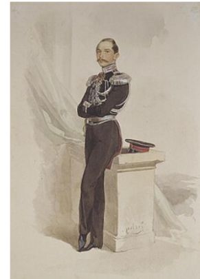
Портрет П. Р. Багратиона работы М. А. Зичи, 1852 г.

17 января 1876 г. – скончался в Санкт-Петербурге от приступа астмы.