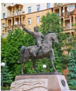
Памятник П. И. Багратиону, г. Москва 1999 г.