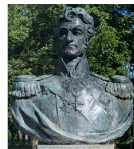
Памятник П. И. Багратиону на Бородинском поле