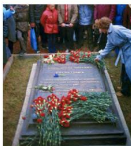
У могилы П. И. Багратиона. Государственный Бородинский военно-исторический музей- заповедник «Бородинское поле».