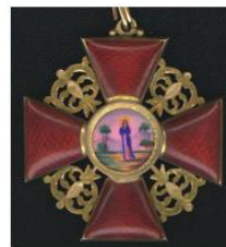
Орден Святой Анны

1799 г. – Австрийский Военный орден Марии Терезии 2-й степени 1799 г. – Сардинский Орден Святых Маврикия и Лазаря 1-й класса 1807 г. – Прусский Орден Чёрного орла 1807 г. – Прусский Орден Красного орла