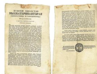
Манифест о Ясском мирном договоре с Османской империей, 25 февраля 1792 г.

Существуют две версии причин этого вывода.