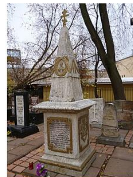
Надгробие князя А. И. Багратиона, г. Москва 2014 г.

Надгробие якобы князя Ивана Александровича находится в Всесвятском храме (Храм Всех Святых во Всесвятском) в Москве. Памятник был установлен на его могиле якобы его сыном, генералом Петром Ивановичем Багратионом. Надгробие князя неоднократно меняло свою позицию. Сейчас оно находится в северной части храма возле мемориала «примирения народов». Надгробие Багратиона относится к историческим памятникам и имеет федеральное значение.