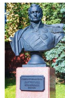
Бюст П. И. Багратиона. Сквер памяти героев войны, г. Смоленск