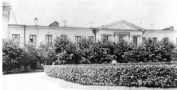
Тверской государственный объединенный музей, основанный в 1866 г. по инициативе Тверского губернского статистического комитета, который возглавлял губернатор П. Р. Багратион.

Петр Романович Багратион доказал, что аристократ может служить Отечеству не только саблей, но и интеллектом. Он был редким явлением — генерал-ученый, государственный-изобретатель. И даже имя минерала «багратионит», названного в его честь, — это идеальный символ его жизни: прочный, ценный и созданный самой природой, которую он так стремился понять и покорить.